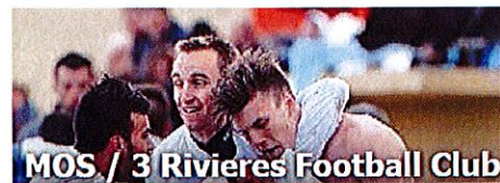
MOS / 3 Rivières Football Club