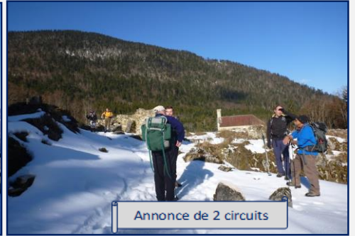
Annnonce de 2 circuits