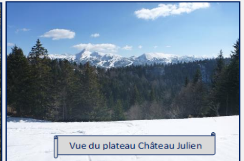
Vue du plateau Château Julien