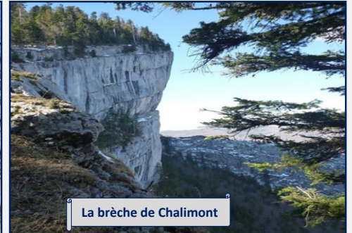
La brèche de Chalimont