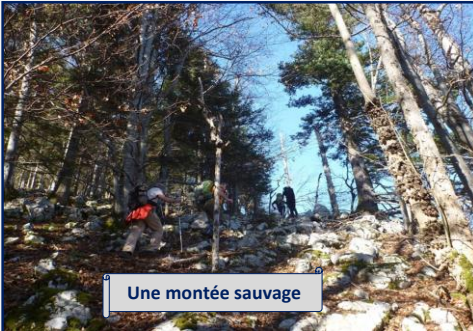
Une montée sauvage