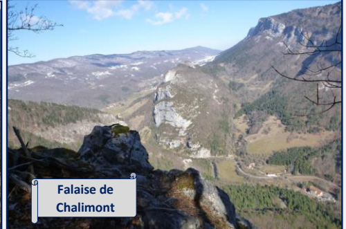
Falaise de Chalimont