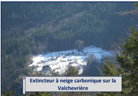
Extincteur à neige carbonique sur la Valchevrière