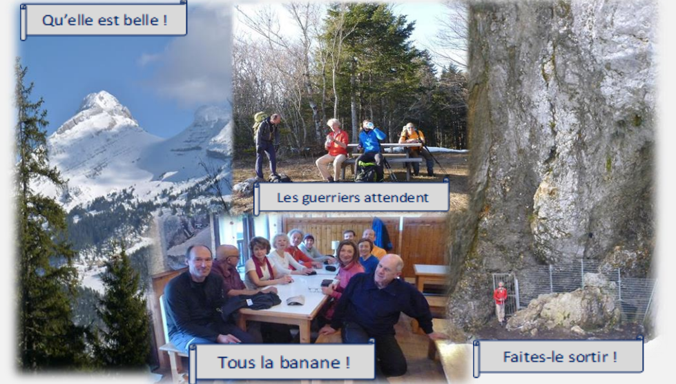
Les guerriers attendent