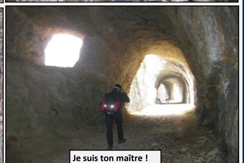
Je suis ton maître !