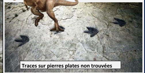
Traces sur pierres plates non trouvées