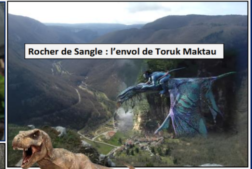
Rocher de Sangle : l'envol de Toruk Maktau