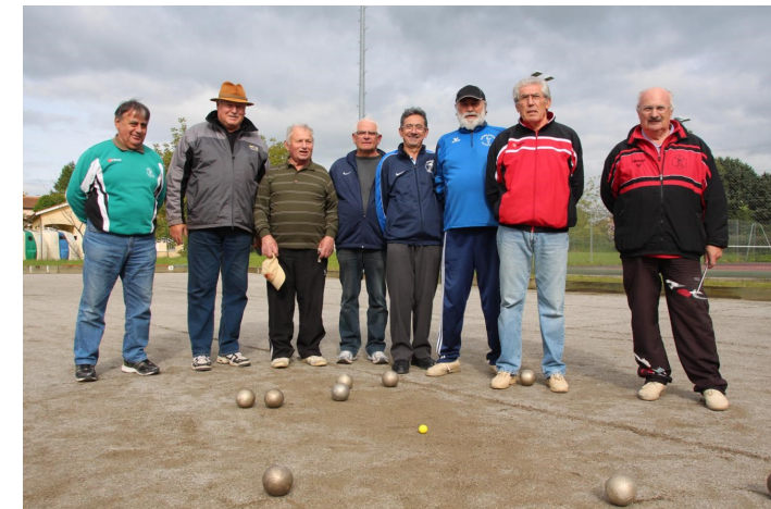
Concours organisé par la Boule Sportive Jardinoise