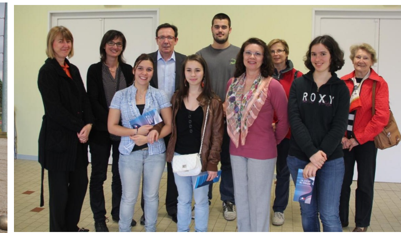
Remise des cartes électorales à de jeunes Jardinois